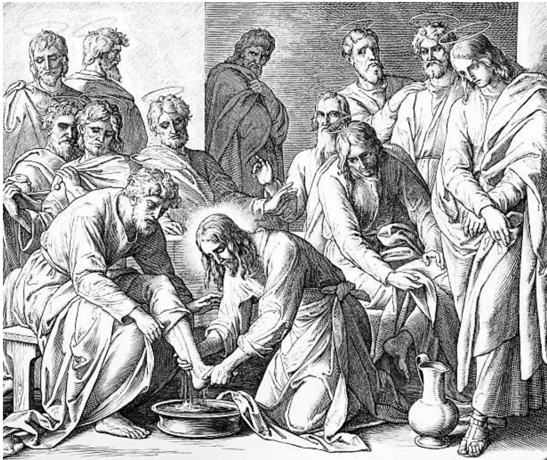
Шнорр фон Карольсфельд Юлиус. Ісус омиває ноги учням. 1860