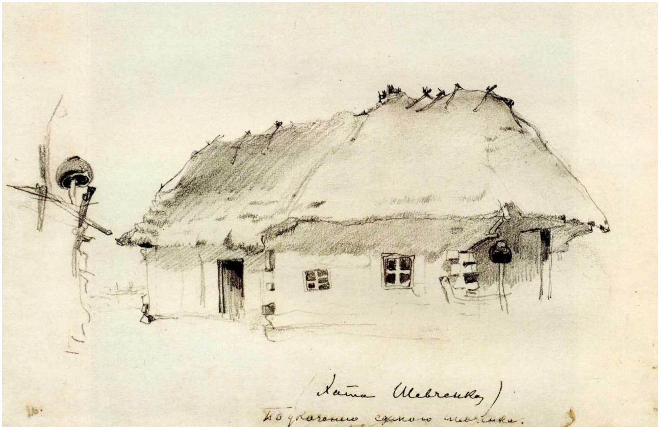
Тарас Шевченко. Хата батьків у Кирилівці. 1843 р.