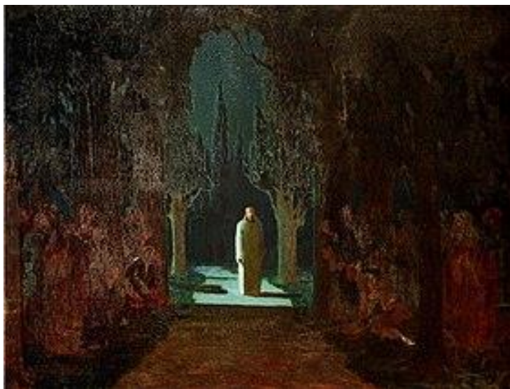
Архип Куїнджі. Христос у Гетсиманському саду. 1901

У житті кожного бувають моменти, коли нібито земля починає йти з-під ніг і підступає тьма тяжких випробувань. Навіть Ісус потребував підтримки Своїх учнів... Коли ти відчуваєш, що хочеш здатися, не треба цього робити. Просто слідуй за Христом.