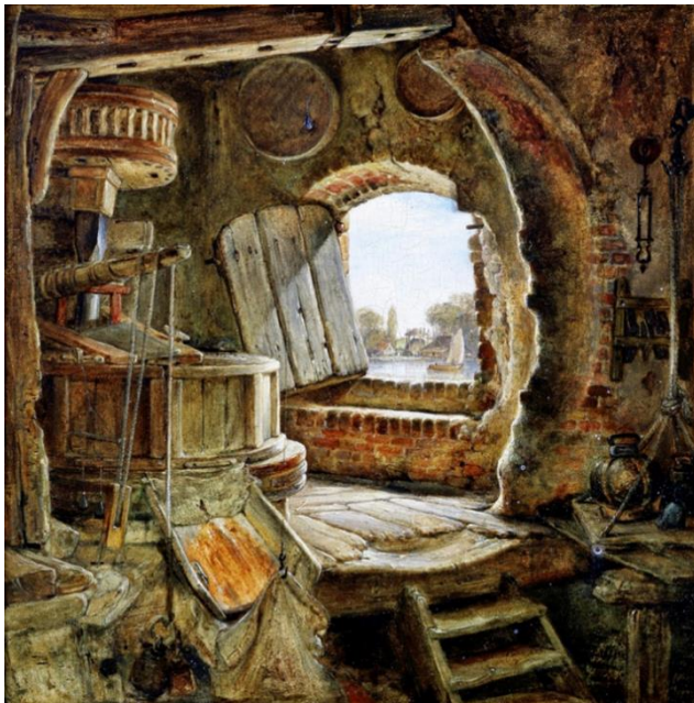
Кук Едвард Вільям. Млин батька Рембрандта. XIX ст.

Батько й мати дарують дитині найцінніший дар – життя. Від них ми отримуємо не лише генетичні риси, а й життєвий досвід, цінності, переконання. На батьках – відповідальність перед Богом і людьми за виховання дитини. Дуже важливо з любов'ю творити нову гарну людину, допомагати їй стати на ноги. На дітей дуже впливає щира віра батьків у них. Добре виховання – це скарб, який залишається у спадок дітям. На цьому тримається світ.