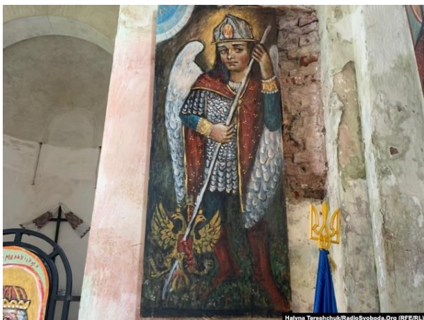
Лев Скоп. Архангел Михаїл

Всі російські тираны мають чомусь прізвища чи псевдоніми, які закінчуються однаково – на -ін. Щоб роздмухати червоний терор, Володимир Ульянов став Леніним. Йосиф Джугашвілі заморив голодом мільйони українців та розправився в ГУЛАГу з мільйонами громадян Радянського Союзу, ставши Сталіним. Через Єльцина прийшов Володимир Путін – військовий злочинець, тиран, лідер рашизму.