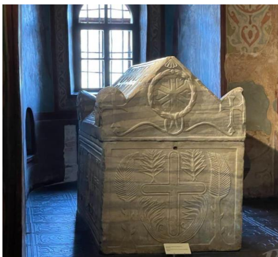
Саркофаг Ярослава Мудрого з похованням його дружини

Її донька – блаженна Едігна – стала взірцем християнської побожності та відданості, її проголосили небесною покровителькою німецької землі Баварія. Вона незаслужено забута (а то й незнана) в Україні, має бути повернена із забуття та належно пошанована в Україні.