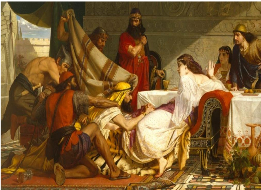
Едвард Армітидж. Свято Естер. 1865

Вороги задумали знищити ізраїльський народ. До Естер-цариці прийшов родич, який промовив: «Якщо ти промовиш в цей час, то звільнення і свобода прийде для народу з іншого місця, а ти загинеш. І хто знає, чи не ради цього часу досягла ти царського престолу». Естер вирішує йти до царя. До такого державного діяча, як цар, не можна було звертатись без попередньої домовленості. І за те, що його відволікають від державних справ, людину страчували. Естер ризикувала своїм життям! Але вона на це не зважала, бо дуже вболівала за долю свого народу. Вона і весь народ постили, молилися три дні.