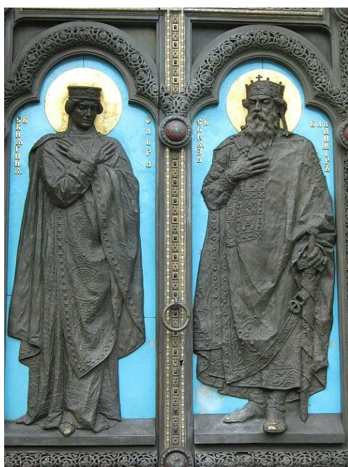
Ворота Володимирського Собору в Києві

Важливо зазначити, що в її княжому роді Рюриковичів вона була першою княгинею-християнкою. Княгиня виховувала своїх онуків у пошані до Христової віри, в любові до Бога й до Його Слова, адже розуміла, що хтось з них буде правити Київською Руссю. Княгиня дуже хотіла, щоб майбутній правитель-князь був послідовником Христа і втілював Заповіді Божі не тільки в своєму житті, а й у керівництві країною. Молитви, старання, надії Ольги на Бога дали свої плоди: Україна стала християнською державою завдяки тому, що її онук, князь Володимир, у 988 році офіційно запровадив християнство на Русі-Україні. І княгиня Ольга, і князь Володимир виконали Боже покликання, Божу волю в своєму житті.