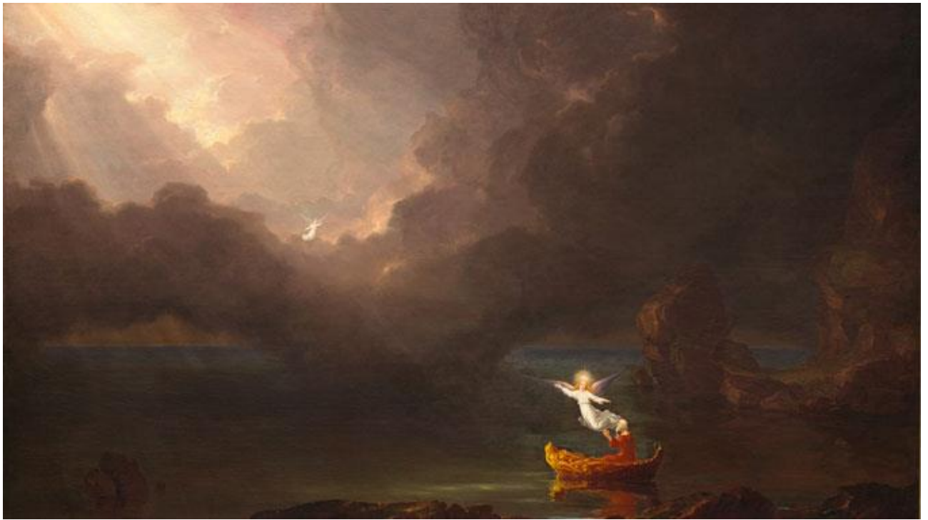
Томас Коул. Подорож життя: старість.