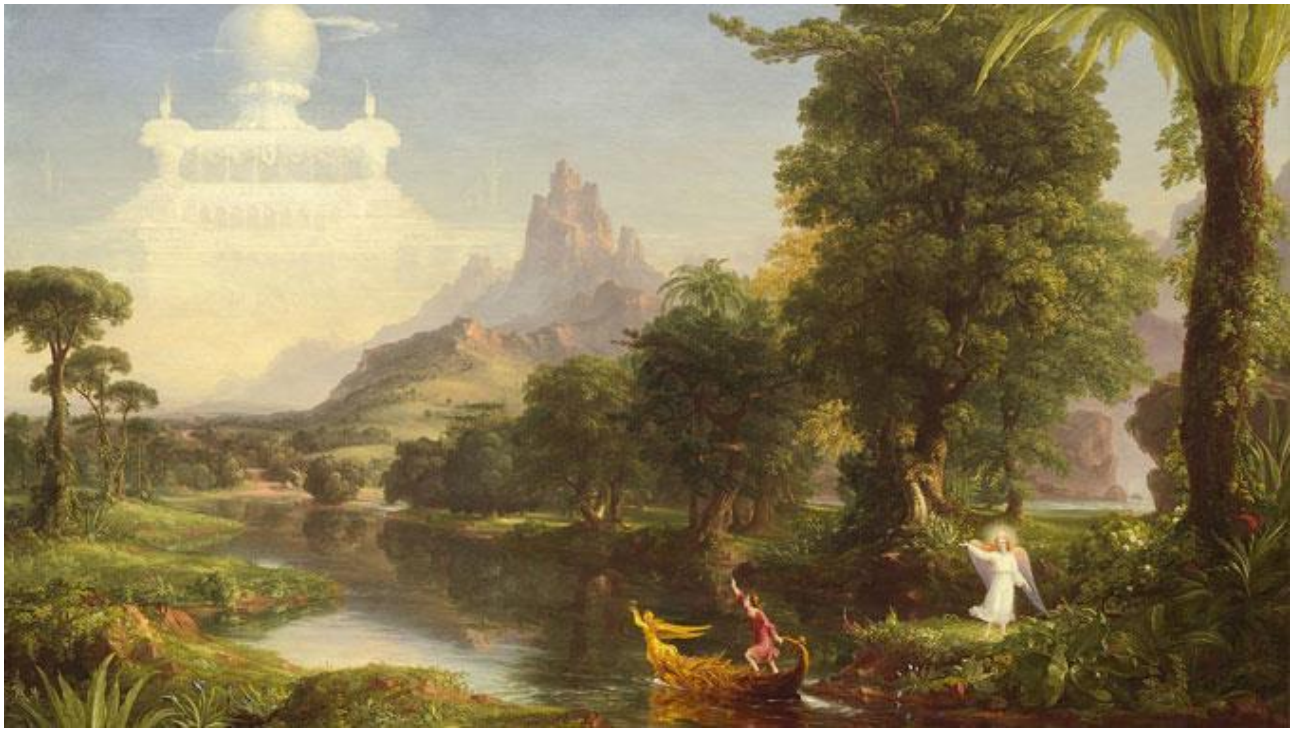
Томас Коул. Подорож життя: Молодість (юність). 1842

https://upload.wikimedia.org/wikipedia/commons/thumb/a/a2/Thomas_Cole_-_The_Voyage_of_Life_Youth%2C_1842_%28National_Gallery_of_Art%29.jpg/1280px-Thomas_Cole_-_The_Voyage_of_Life_Youth%2C_1842_%28National_Gallery_of_Art%29.jpg