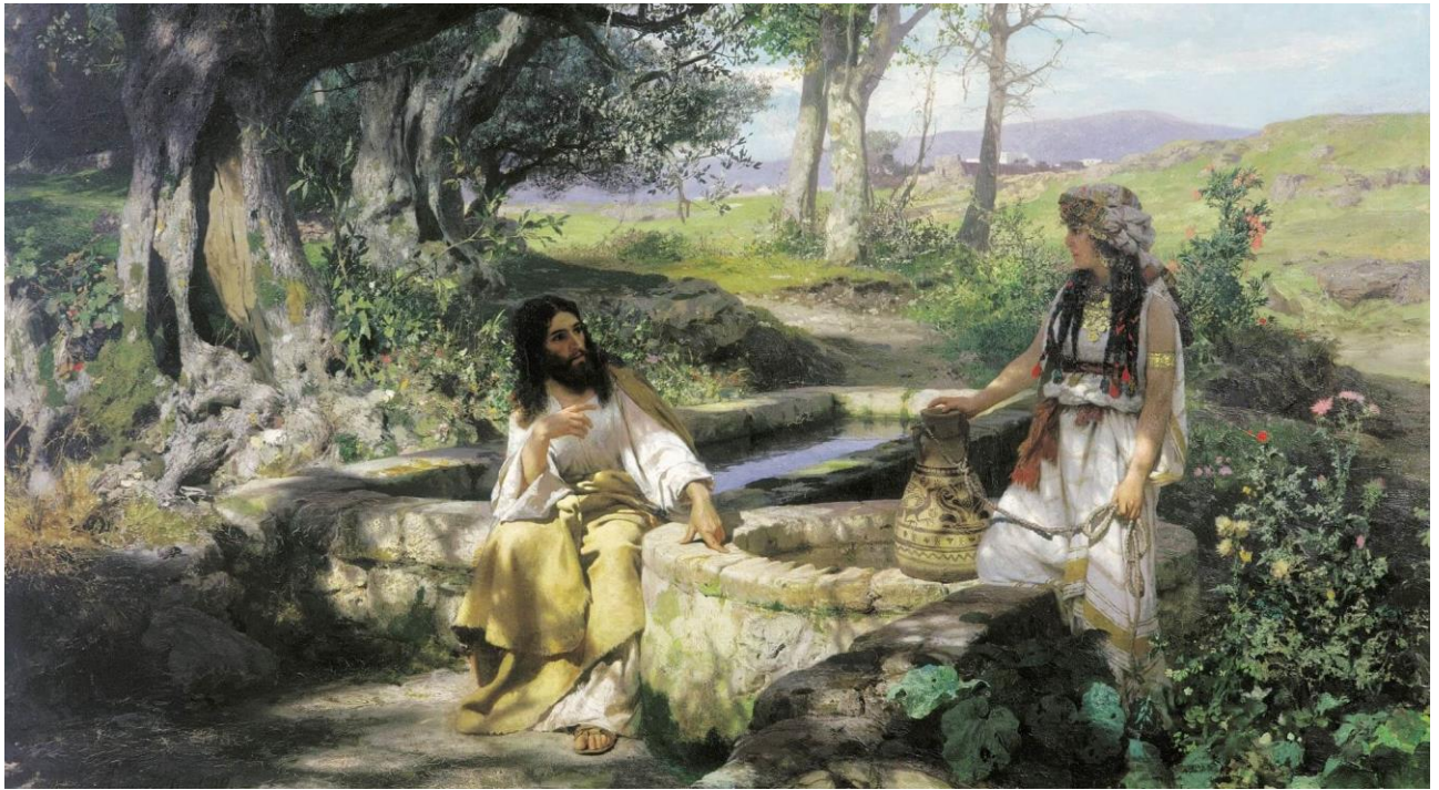
Генріх Семирадський. Христос і самаритянка. 1890

кого маєш тепер, не муж тобі. Ти правду сказала». Каже жінка до Нього: «Бачу, Пане, що Ти Пророк. Отці наші вклонялися Богу на цій горі, а ви твердите, що потрібно в Єрусалимі». Ісус промовляє: «Повір, надходить час, коли ні на горі, ані в Єрусалимі вклоняться не будете ви. Вклоняться будуть Отцеві в душі та в правді, бо Отець Собі прагне таких богомольців. Бог є Дух, і ті, що Йому вклоняються, повинні в душі та в правді вклонятись». Відказує жінка: «Я знаю, що прийде Месія Христос і все нам розповість». Промовляє Ісус: «Це Я, що розмовляю з тобою». Надійшли Його учні й дивувалися, що Господь розмовляв із жінкою. Проте жоден із них не спитав: «Про що з нею говориш?» Покинула жінка Ісуса, побігла до міста й каже людям: «Ходіть, побачте пророка. Чи Він не Христос?». І вони прийшли до Нього.