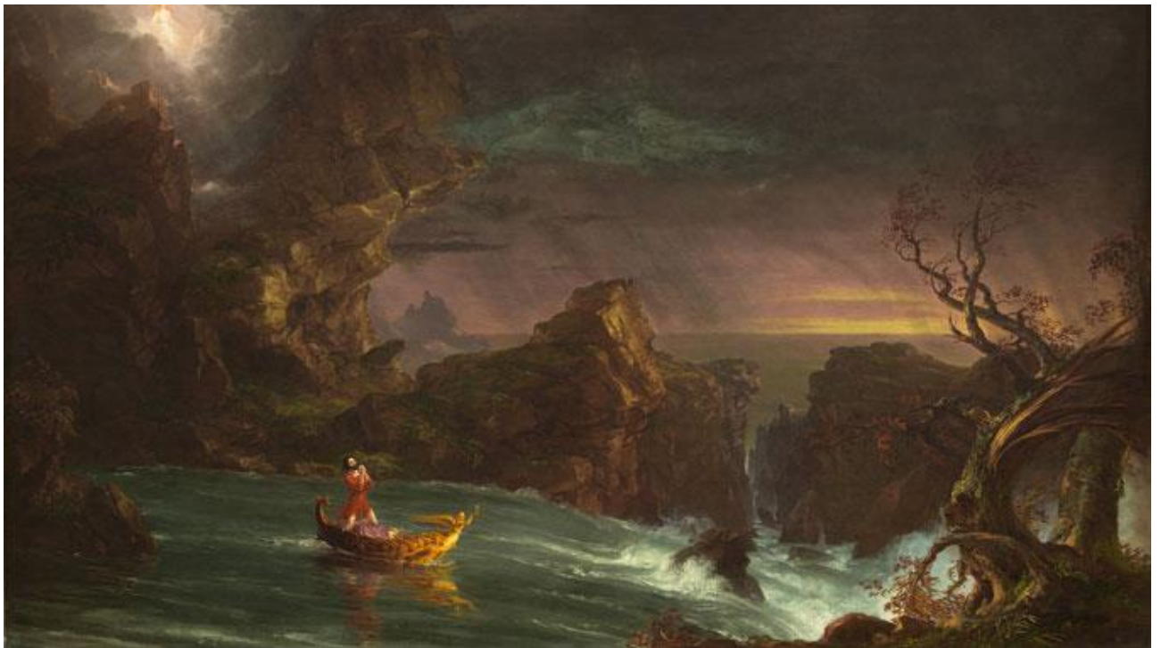
Томас Коул. Подорож життя: зрілість.

The Voyage of Life Youth%2C 1842 %28National Gallery of Art%29.jpg/1280px-Thomas Cole - The Voyage of Life Youth%2C 1842 %28National Gallery of Art%29.jpg