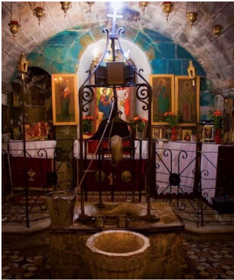
Храм святої Фотинії Самаритянки в місті Наблусі