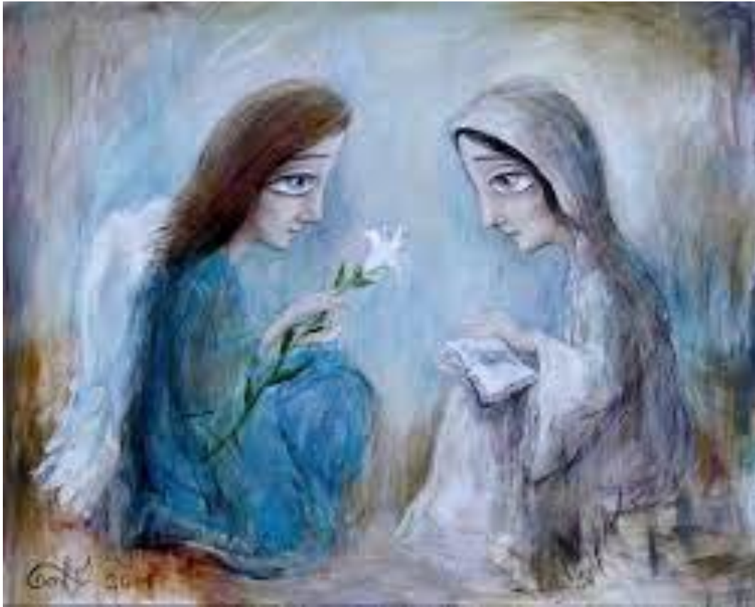
Ніно Чакветадзе. Благовіщення. 2011 рік

А шостого місяця від Бога був посланий Ангол Гавриїл у галілейське місто, що йому на ім'я Назарет, до діви, що заручена з мужем була, на ім'я йому Йосип, із дому Давидового, а ім'я діві Марія.