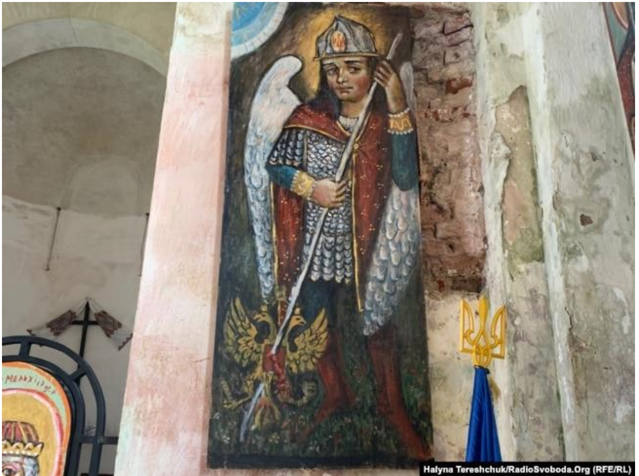
Лев Скоп. Архангел Михаїл