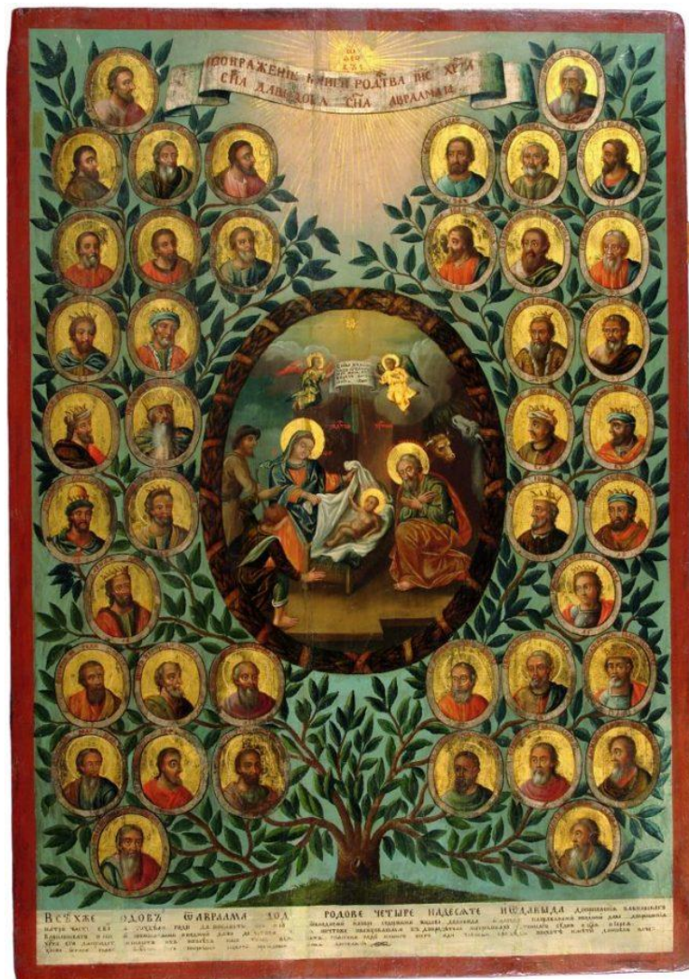
Українська ікона від пізнього Середньовіччя до кінця XXVII століття