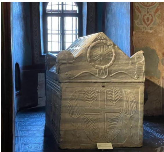
Саркофаг Ярослава Мудрого з похованням його дружини

Її донька– блаженна Едігна – стала взірцем християнської побожності та відданості, її проголосили небесною покровителькою німецької землі Баварія. Вона незаслужено забута (а то й незнана) в Україні, має бути повернена із забуття та належно пошанована в Україні.