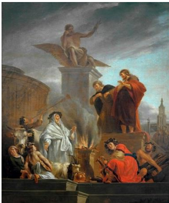
Ілюстрація: Ніколас Берхем, Апостоли Павло і Варнава у Лістрі, 1650 р.