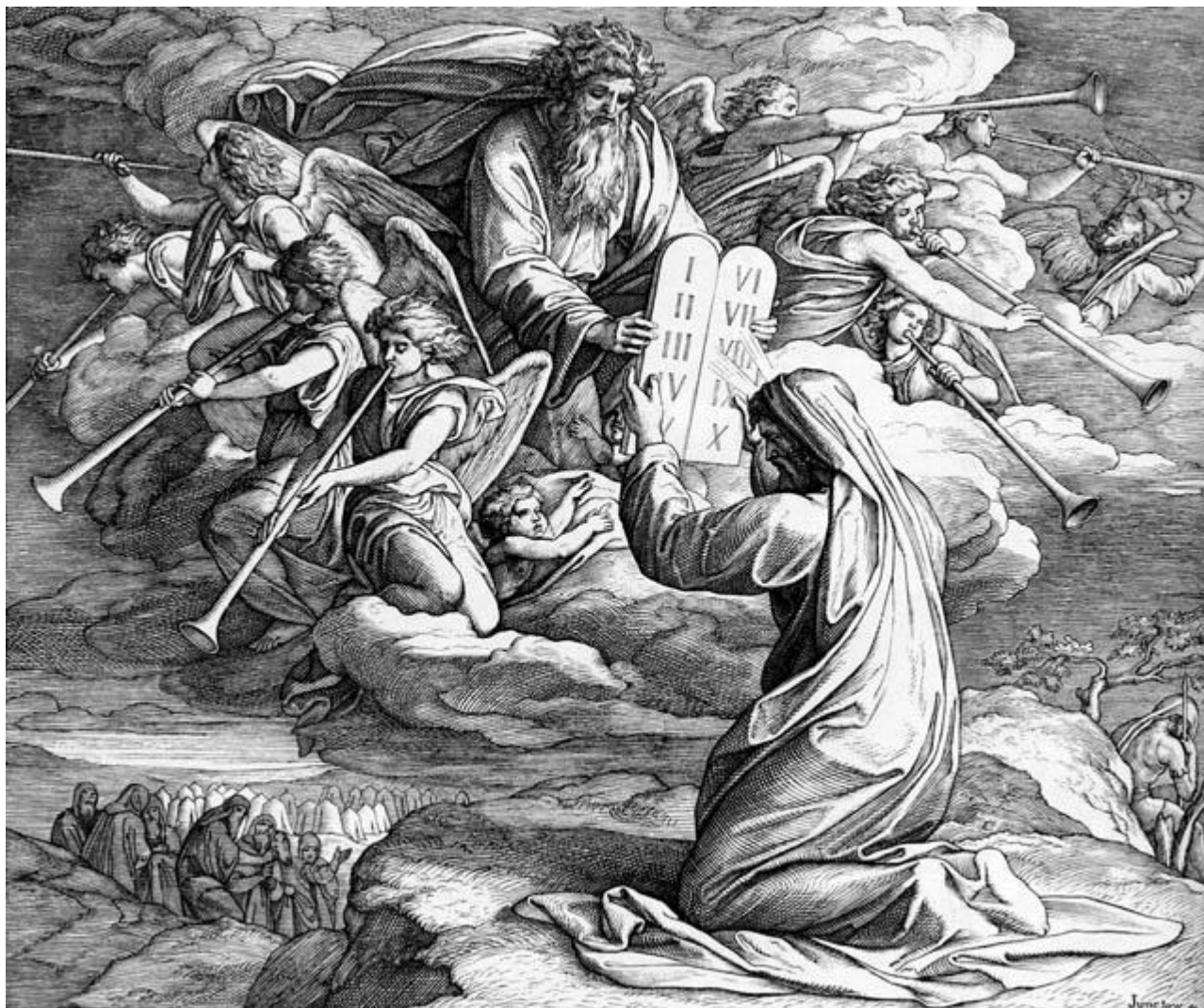
Десять заповідей, Юліус фон Каролсфельд