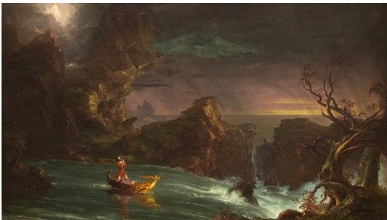
Томас Коул. Подорож життя: зрілість.