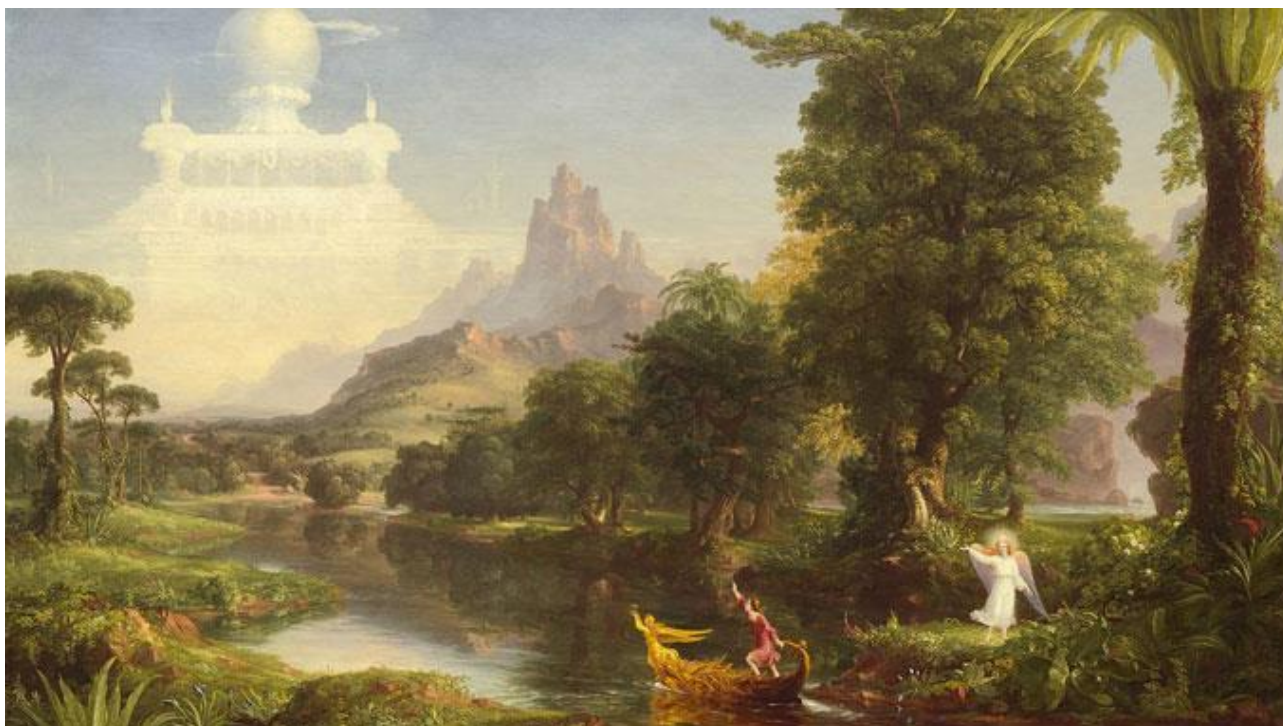
Томас Коул. Подорож життя: юність.

2. Уважно роздивіться репродукції картин Томаса Коула з серії «Подорож життя», присвячені дитинству, юності, зрілості, старості. Жеребкуванням оберіть одну з робіт художника, поділіться, що хотів донести людству митець.