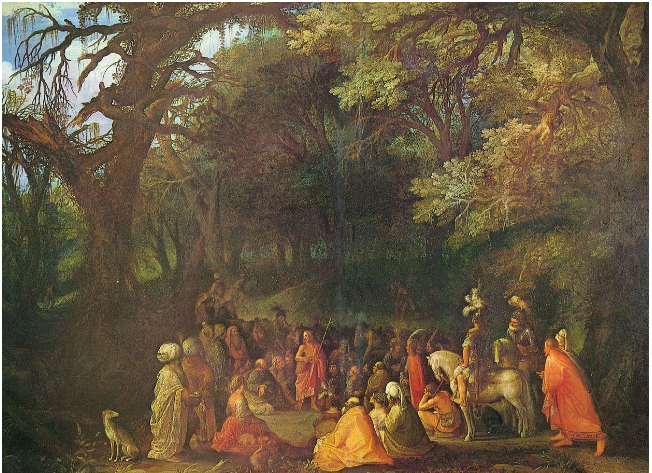
Адам Ельсгаймер. Іван Хреститель проповідує на берегах Йордану. 1602

Іван Хреститель, почувши у в'язниці про дії Христа, послав своїх учнів запитати Його: «Чи Ти Той, Хто має прийти, чи нам чекати Іншого?». Ісус відповів їм: «Ідть і перекажіть Іванові, що ви чуєте й бачите: сліпі прозрівають, криві ходять, зцілюються прокажені, чують глухі, померлі оживають, а вбогим звіщається Добра Новина. Блаженний, хто через Мене спокуси не матиме!» Про Івана Ісус сказав до людей: «На що ви ходили в пустелю дивитися? Чи на очерет? Чи на чоловіка, одягненого у м'які шати? Бо ті, хто носить м'яке, – по царських палатах. По що ж ви ходили? Може, побачити пророка? Так, навіть більш ніж пророка. Це той, про якого написано: “Ось перед обличчя Твоє посилаю Свого посланця, який перед Тобою дорогу Твою приготує!”